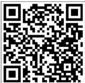
Vragenlijst organisatoren van evenementen

Wat gaat goed? Wat kan beter? Hoe ervaart u de samenwerking met de gemeente? We horen graag uw ervaringen en ideeën.